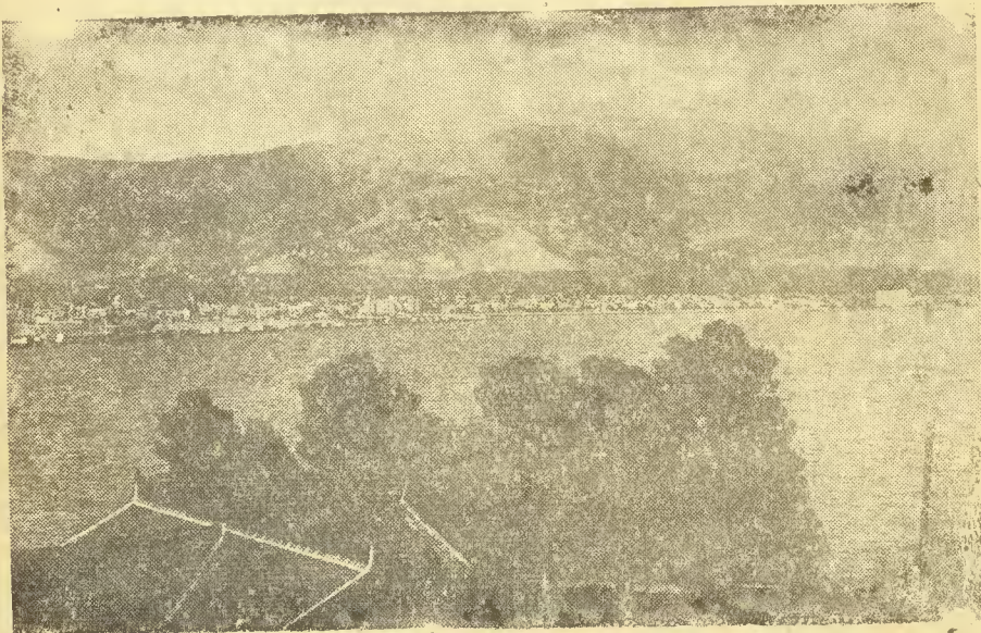
Ἐξ ὧν καὶ ἡ πατρὶς τοῦ ἁγίου, ἡ Ζαγορά